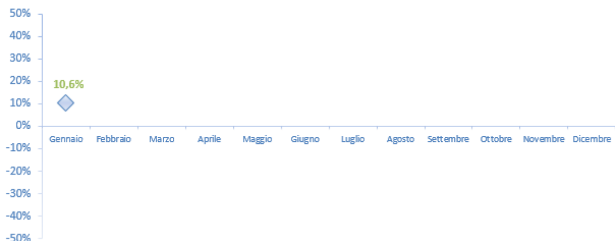
Figura 7 - Var. % 2017/2016 - Treni totali (arrivi+partenze)