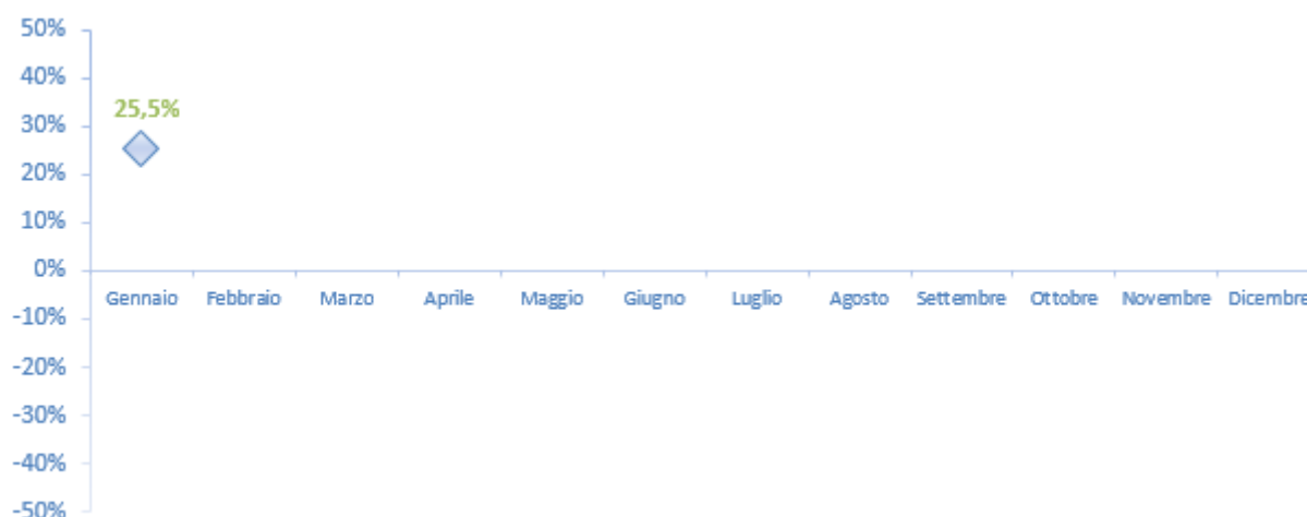
Figura 10 - Var. % 2017/2016 - Carri totali (arrivi+partenze)

A livello congiunturale (gennaio 2017 rispetto a dicembre 2016) si registra una crescita dell'11.2% circa per quanto riguarda il numero totale dei carri in arrivo e in partenza.