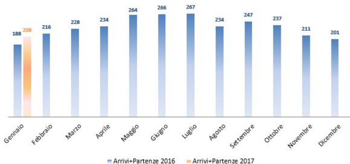
Figura 6: Treni in arrivo e in partenza dall'Interporto nel biennio 2016/2017

Nel mese di gennaio 2017, l'Interporto di Bologna registra un incremento del numero dei treni totali (arrivi + partenze) rispetto allo stesso periodo del 2016 (10,6% corrispondenti a 20 treni in più).