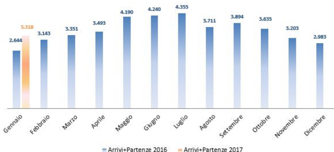
Figura 9: Carri in arrivo e in partenza dall'Interporto nel biennio 2016/2017

Nel mese di gennaio 2017 il traffico dei carri, come quello dei treni e dei camion, è stato caratterizzato da un segno positivo (25.5%).