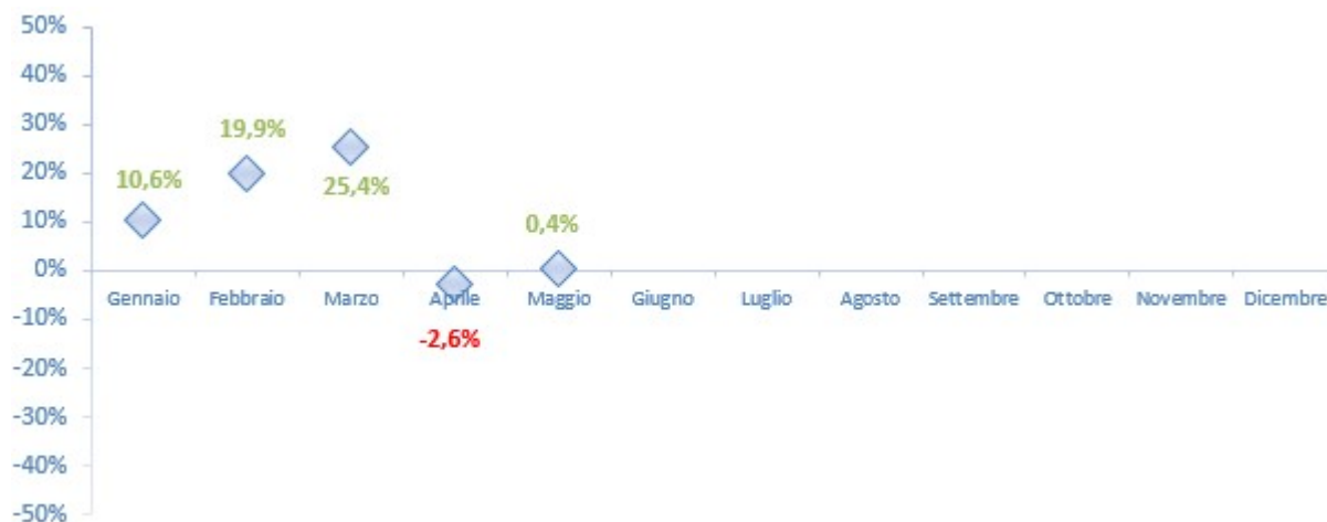
Figura 7 - Var. % 2017/2016 - Treni totali (arrivi+partenze)