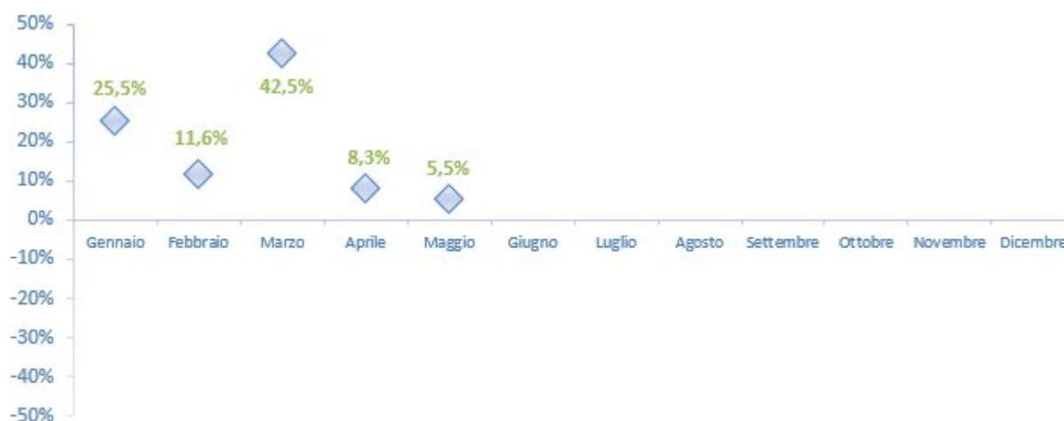
Figura 10 - Var. % 2017/2016 - Carri totali (arrivi+partenze)

Il cumulato del periodo (Gennaio-Maggio) mostra, invece, un incremento leggermente superiore al precedente e pari al 18%.