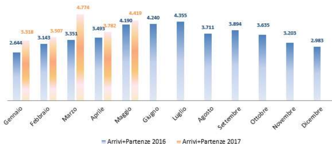
Figura 9: Carri in arrivo e in partenza dall'Interporto nel biennio 2016/2017

Nel mese di maggio 2017 il traffico dei carri è stato caratterizzato da un segno positivo (+6% rispetto a maggio 2016).