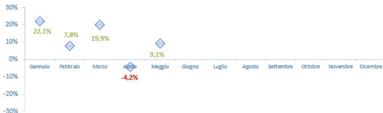
Figura 3 - Var. % 2017/2016 - Camion totali (entrate+uscite)

La suddivisione per fascia oraria evidenzia, come di consueto, una concentrazione delle entrate tra le 12:00 e le 18:00 con 26.254 transiti (corrispondenti al 38% delle entrate totali).